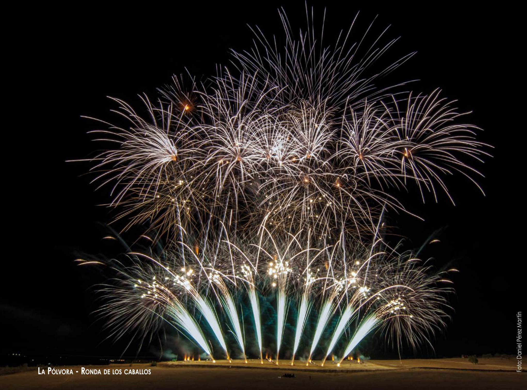
LA PÓLVORA - RONDA DE LOS CABALLOS