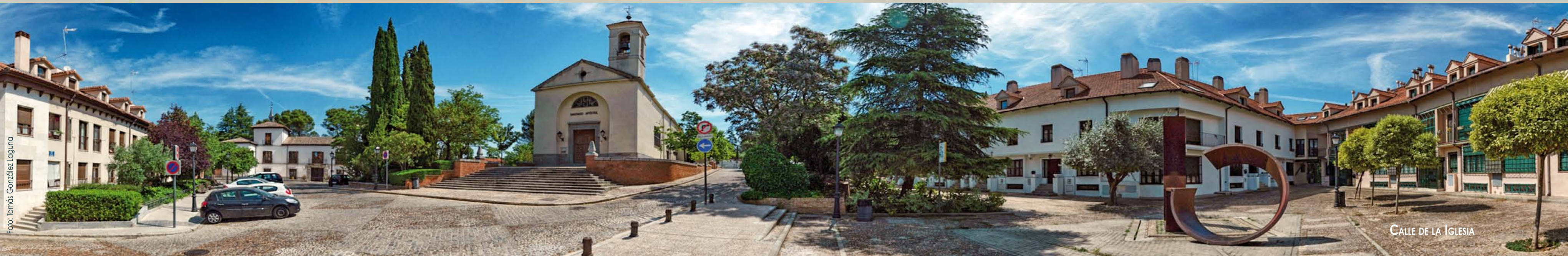
CALLE DE LA IGLESIA