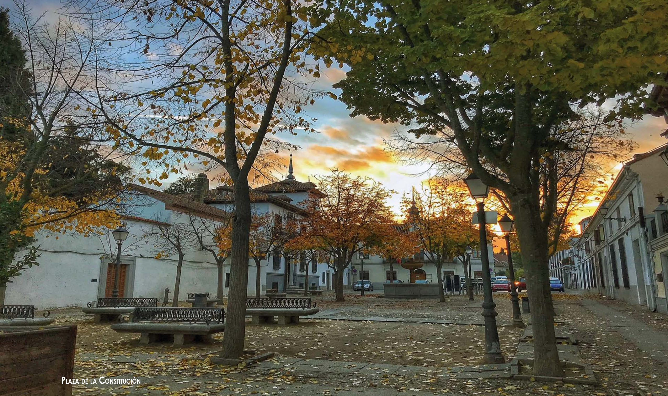
PLAZA DE LA CONSTITUCIÓN