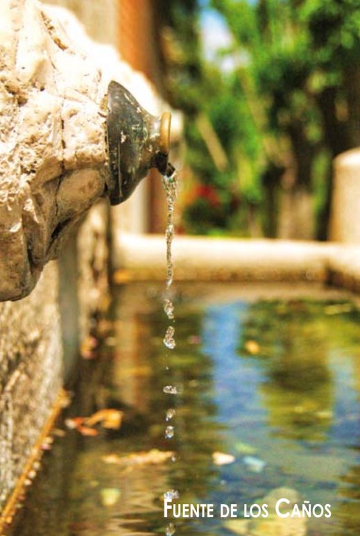
FUENTE DE LOS CAÑOS

Un día unos paseantes se sentaron junto a la fuente que brotaba en el rellano y hablaron de que el Gobierno iba a crear una carrera denominada de Ingenieros de Montes, para el estudio del arbolado y plantas silvestres, su cultivo, defensa y repoblación. (...)