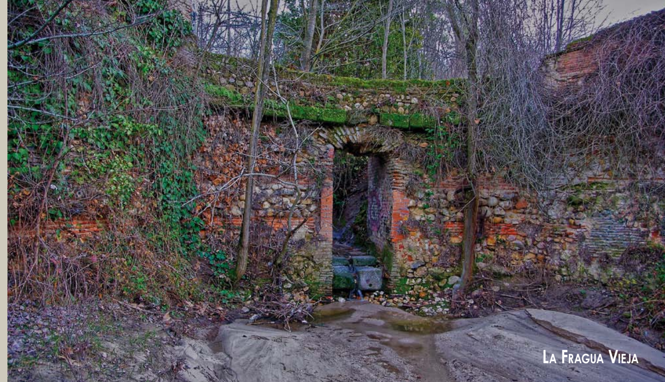
LA FRAGUA VIEJA

En una capilla de la iglesia del convento se veneraba la hermosa imagen del Santísimo Cristo del Milagro, adquirida por la piedad de los habitantes de Odón, (...). Esta milagrosa imagen fue trasladada, muchos años después, a la modesta iglesia que, bajo la advocación de Santiago Apóstol, se levantó en un cerrillo situado más allá del convento. En este cerrillo había muchos y frondosos árboles, (...)