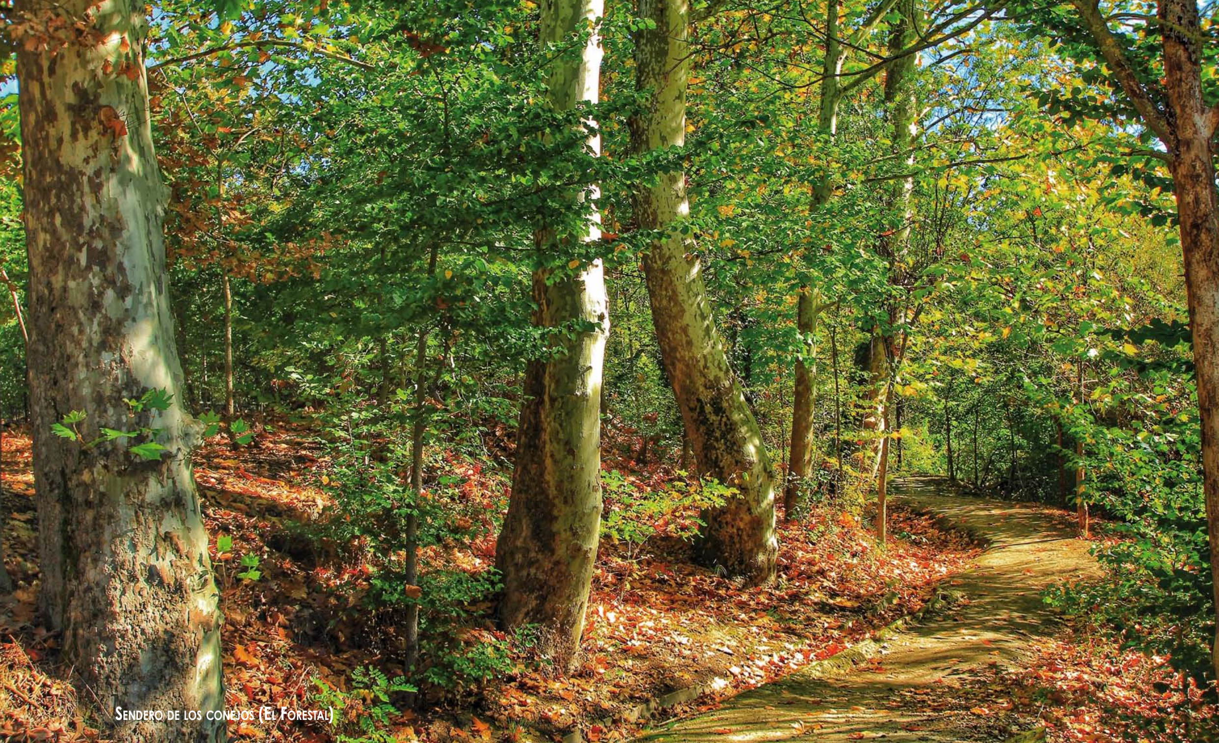
SENDERO DE LOS CONEJOS (EL FORESTAL)