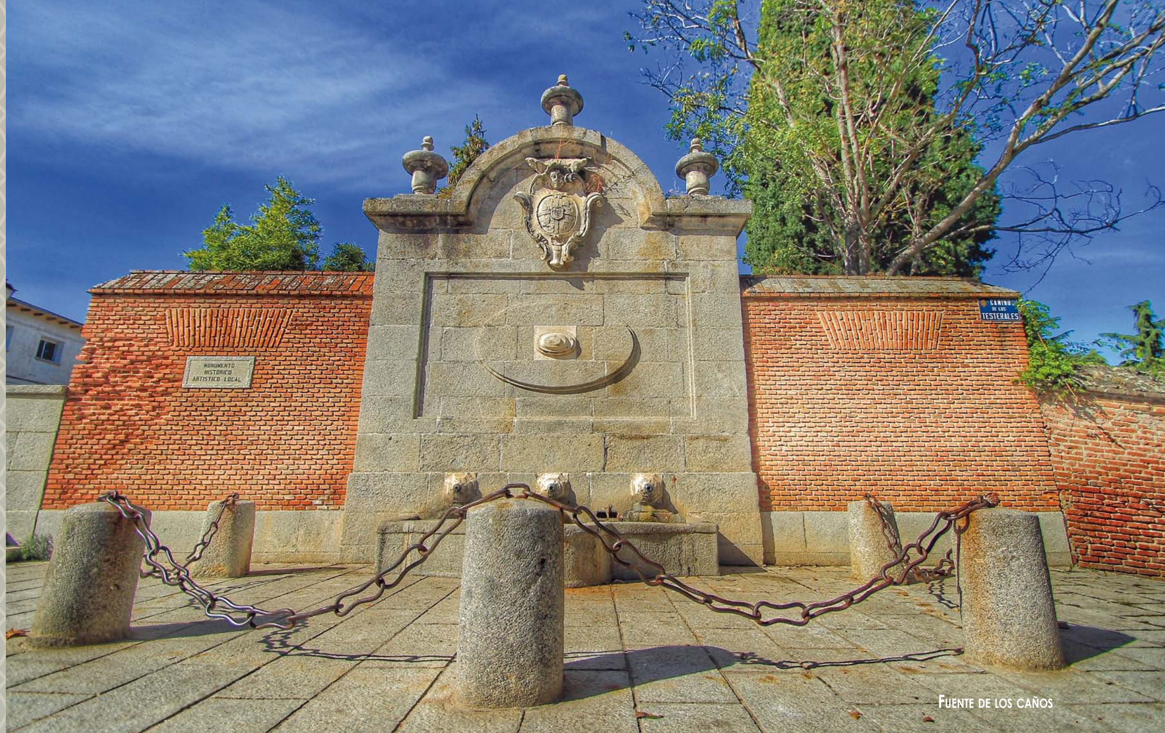
FUENTE DE LOS CAÑOS