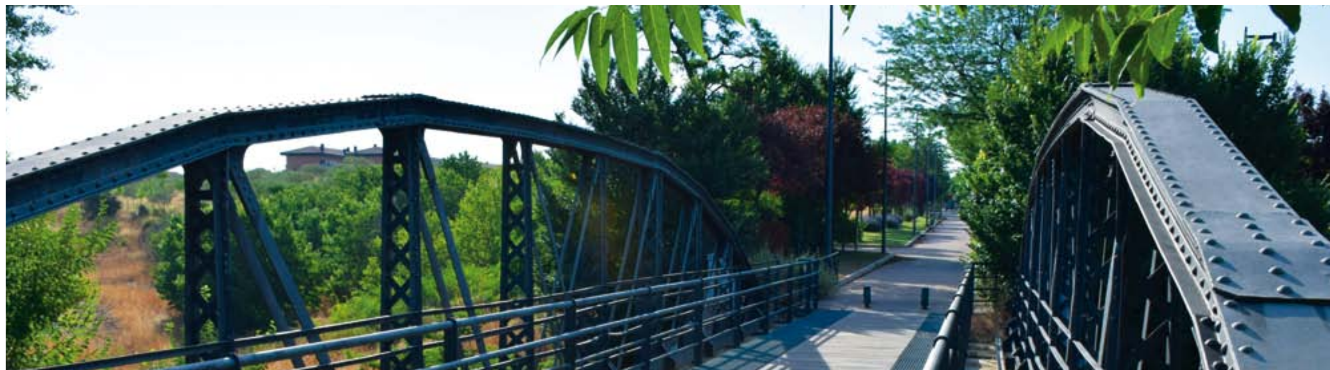
PUENTE DE HIERRO SOBRE EL ARROYO DE LA VEGA (AVENIDA PRÍNCIPE DE ASTURIAS)