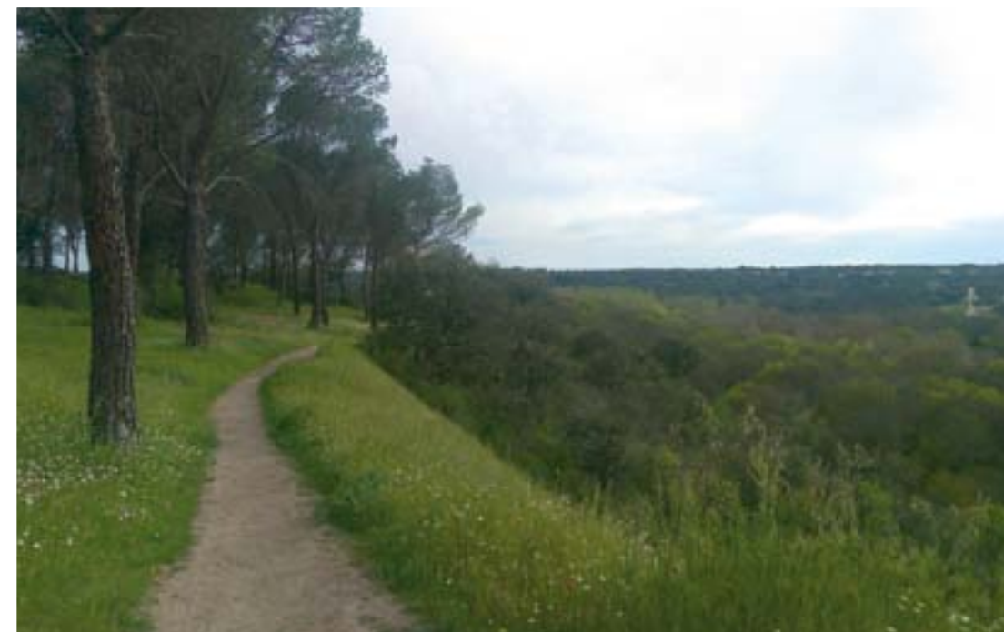
RINCONES NATURALES: EL MONTE DE LA CONDESA