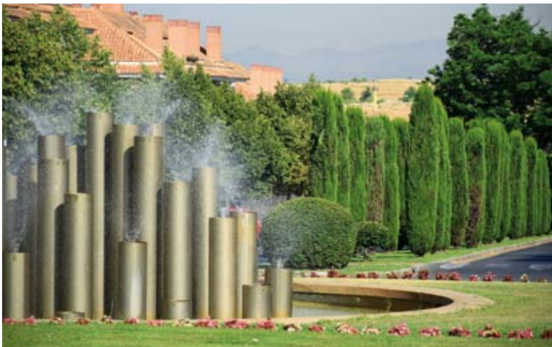
FUENTE DE LOS TUBOS, OBRA DE BORJA BALLARÍN IRIBARREN (AVENIDA PRÍNCIPE DE ASTURIAS)