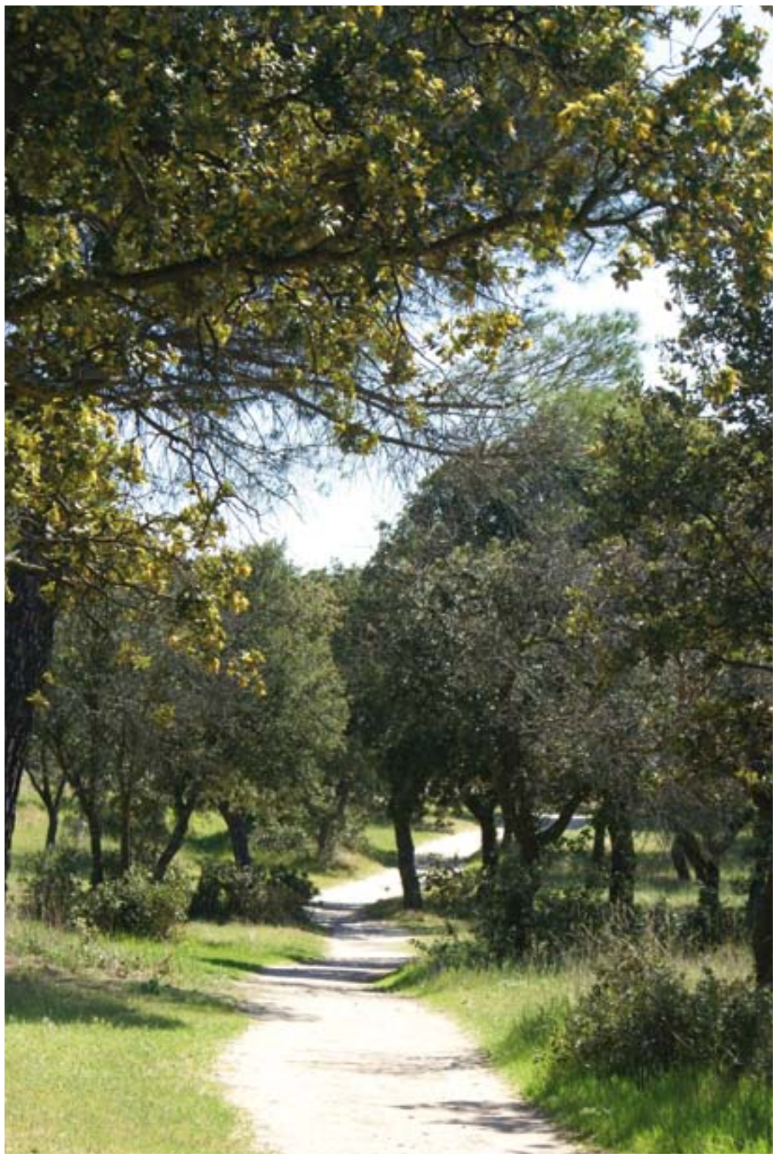
RINCONES NATURALES: EL MONREAL