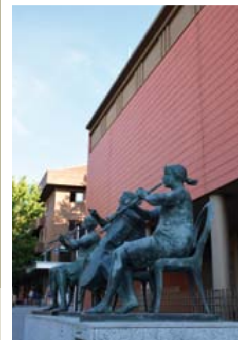
TRIO MUSICAL, OBRA DE JOSÉ CARRILERO (AVENIDA PRÍNCIPE DE ASTURIAS)