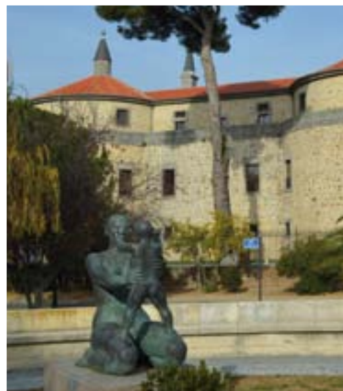
LA MATERNIDAD, OBRA DE JOAQUÍN GARCÍA DONAIRE (PARQUE DE EL CASTILLO)