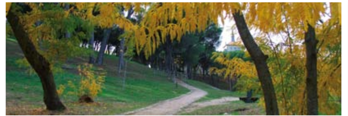
CAMINO Y SENDERILLO DE LOS LAVADEROS (PINAR DE PRADO REDONDO)