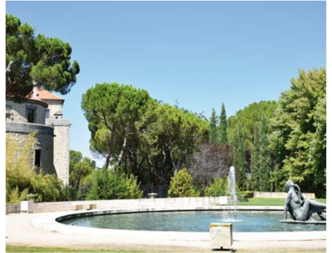
ESULTURA DE LEDA Y EL CISNE, OBRA DE JUAN DE ÁVALOS, SITUADA EN EL ESTANQUE DE FERNANDO VI, JARDÍN HISTÓRICO (AVENIDA DE MADRID)