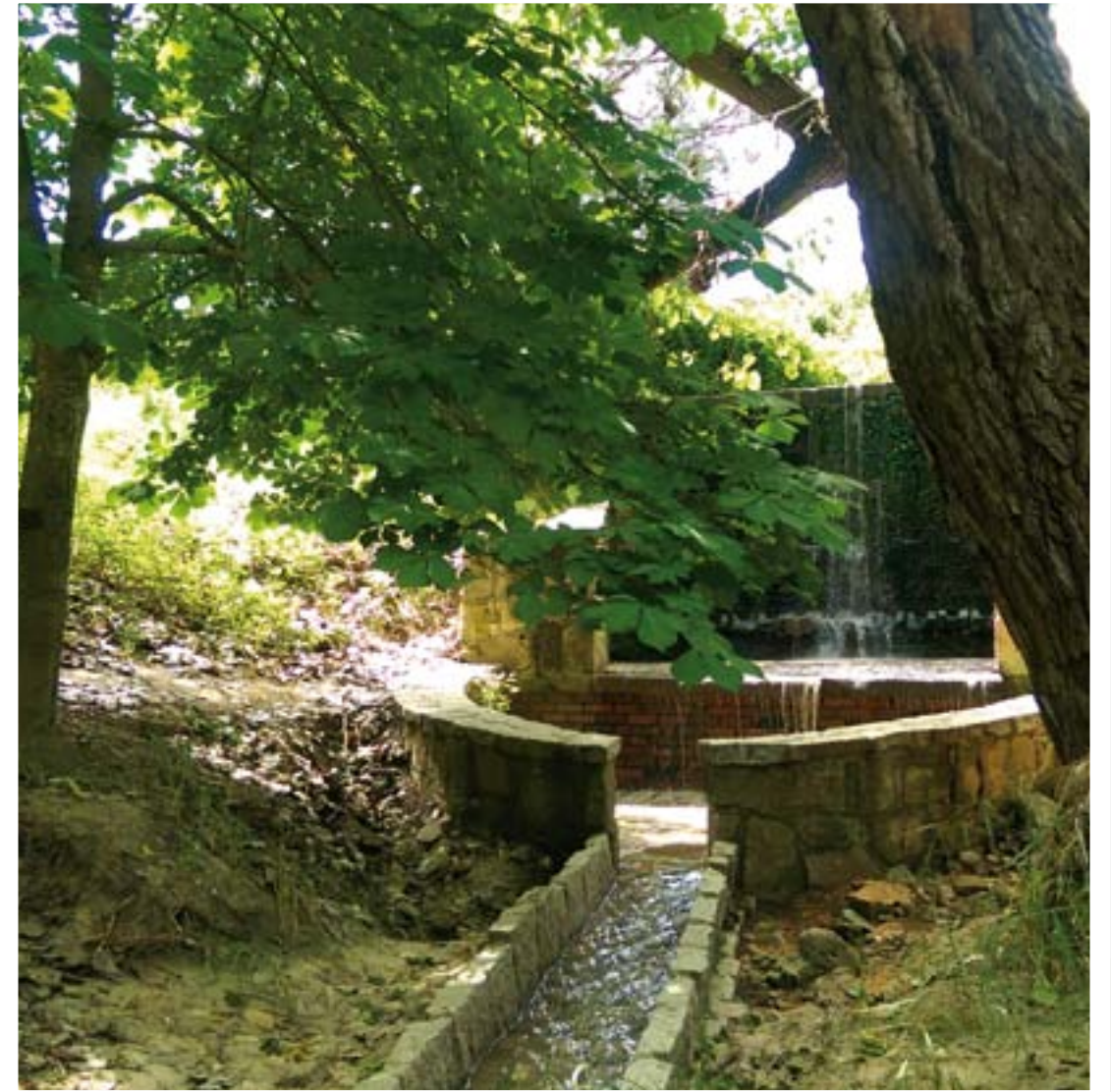
EL PAREDÓN (EL FORESTAL)