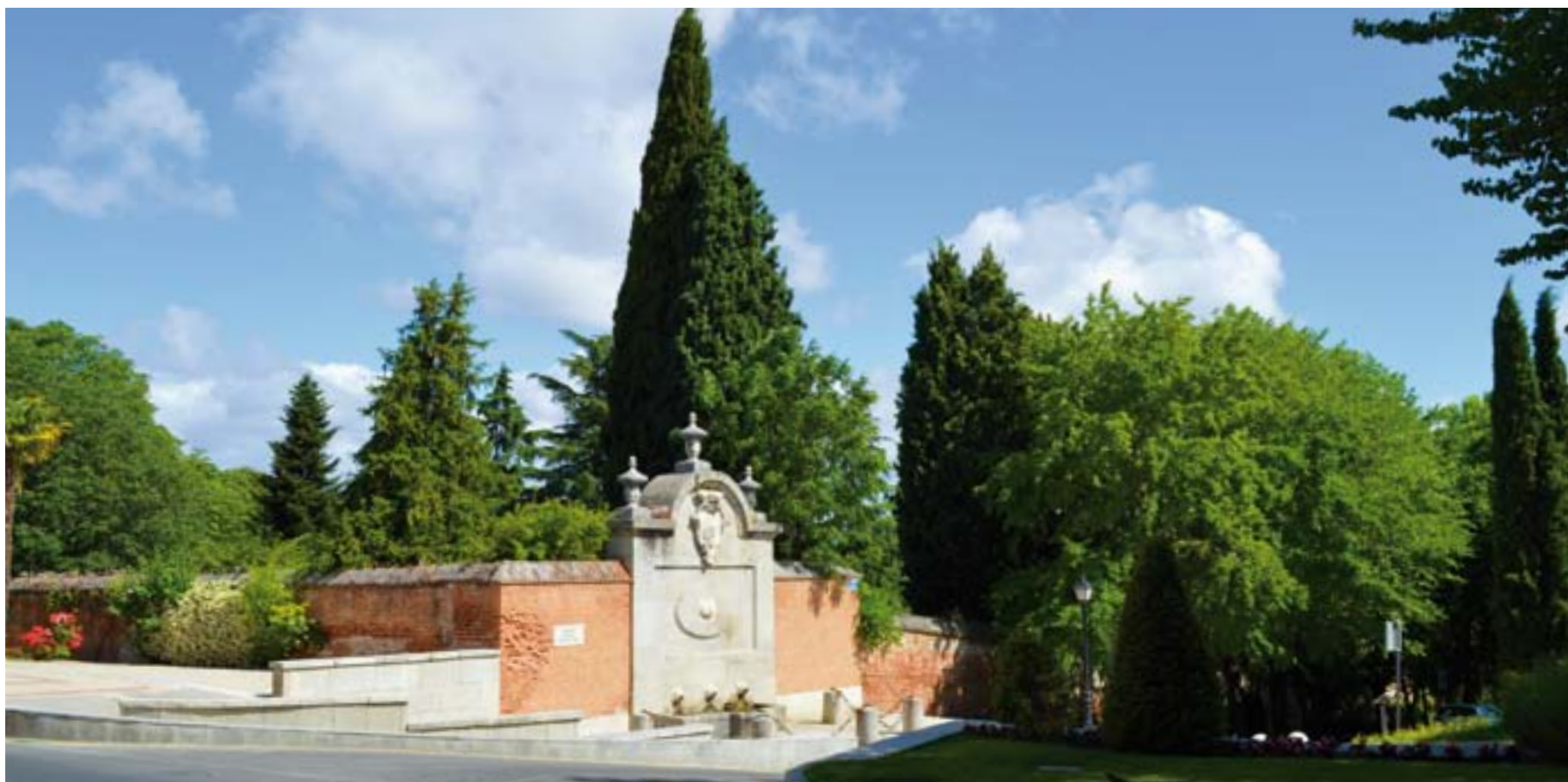
FUENTE DE LOS CAÑOS, OBRA ATRIBUIDA A VENTURA RODRÍGUEZ. DECLARADA DE INTERÉS HISTÓRICO ARTÍSTICO (CAMINO DE LOS TESTERALES)