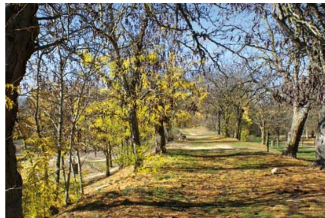
RINCONES NATURALES: EL SOTILLO