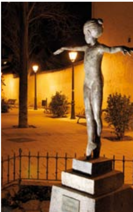
LA BAILARINA, OBRA DE PILAR CUENCA (CALLE GONZALO CALAMITA)