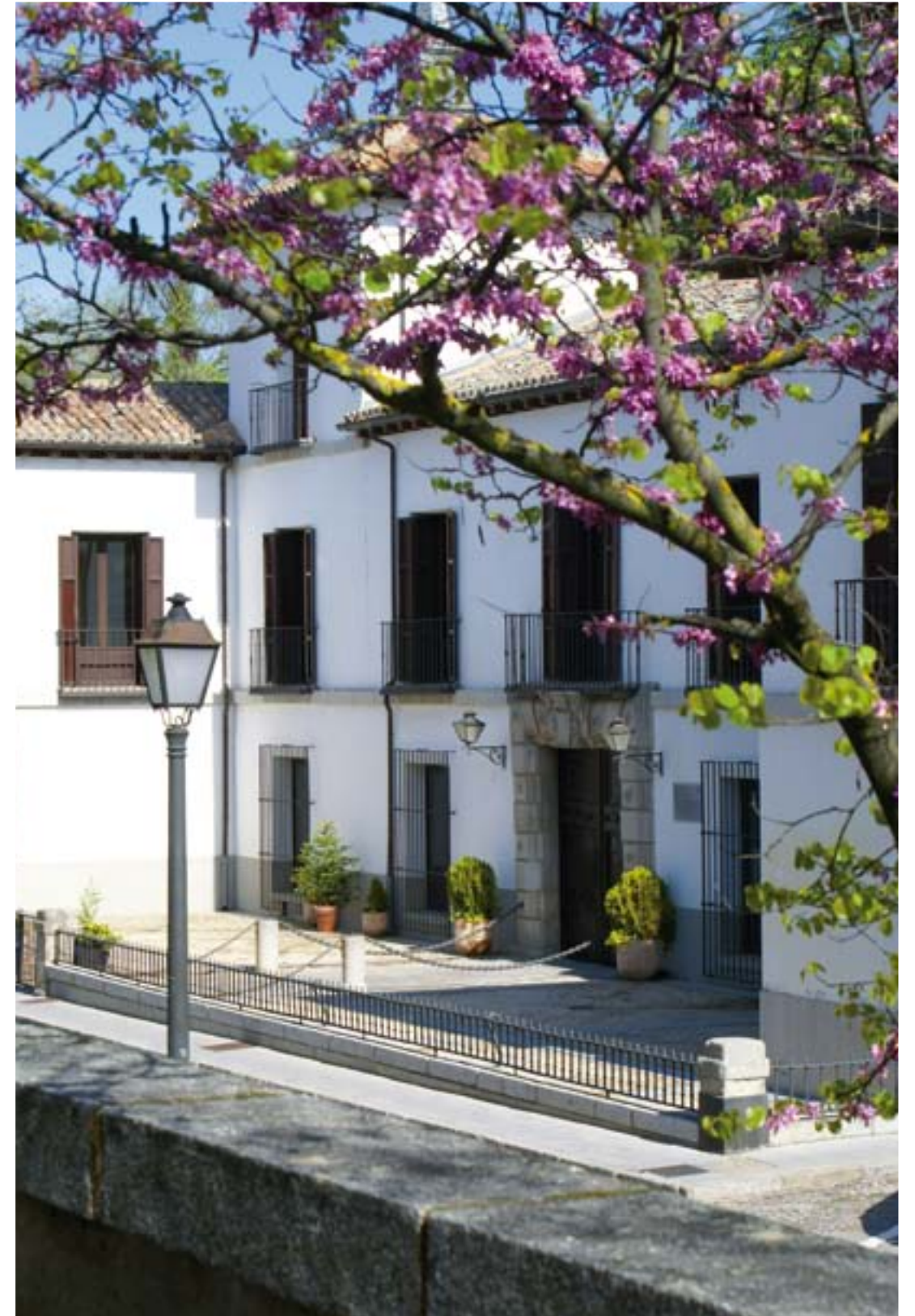
CASA PALACIO MANUEL GODOY, SIGLO XVII (CALLE DEL ARROYO)