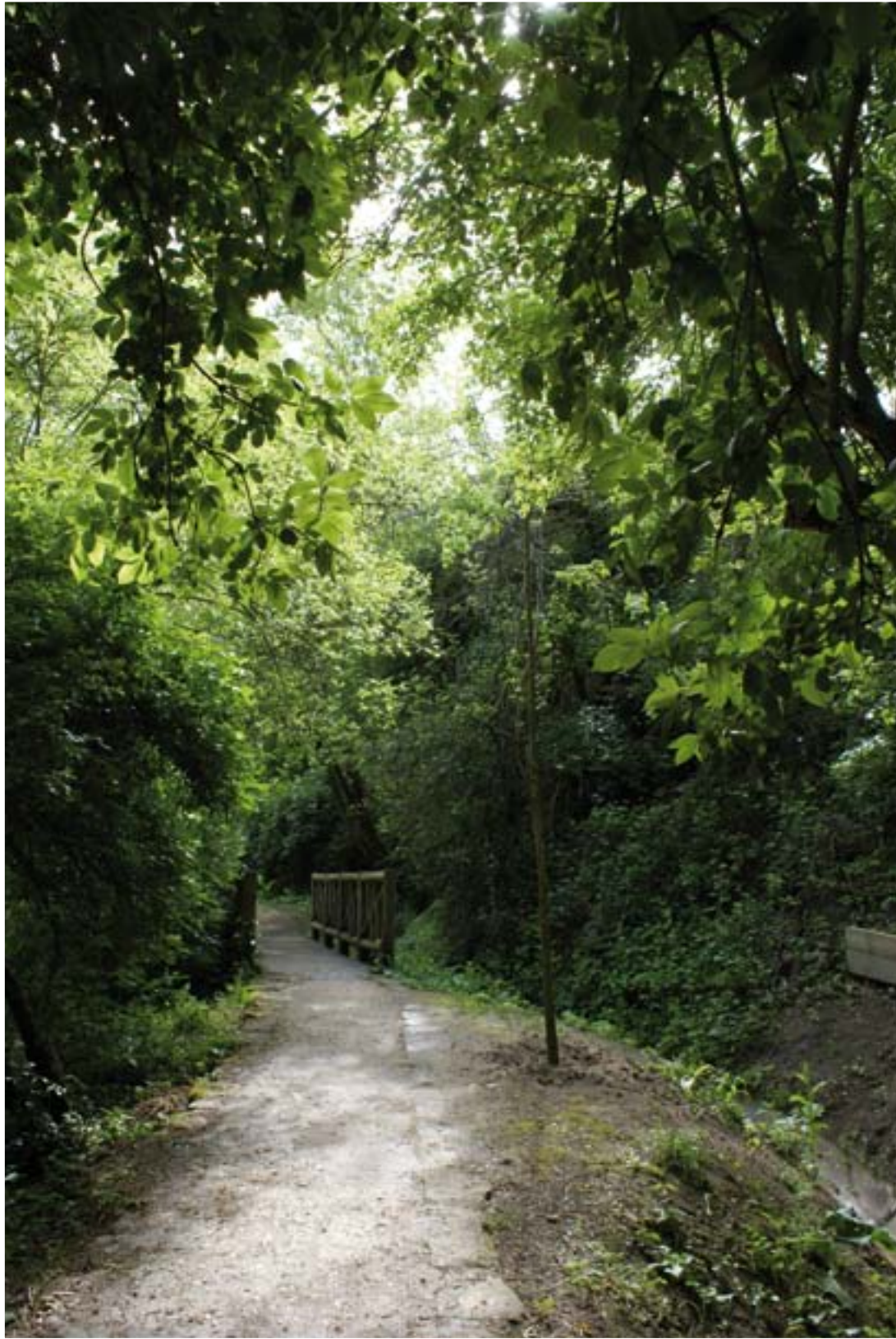
CAMINO DEL CAÑO DORADO (EL FORESTAL)