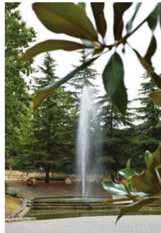
PARQUE DE EL CASTILLO, POPULARMENTE CONOCIDO COMO PARQUE DE LOS PATOS (AVENIDA DE MADRID)