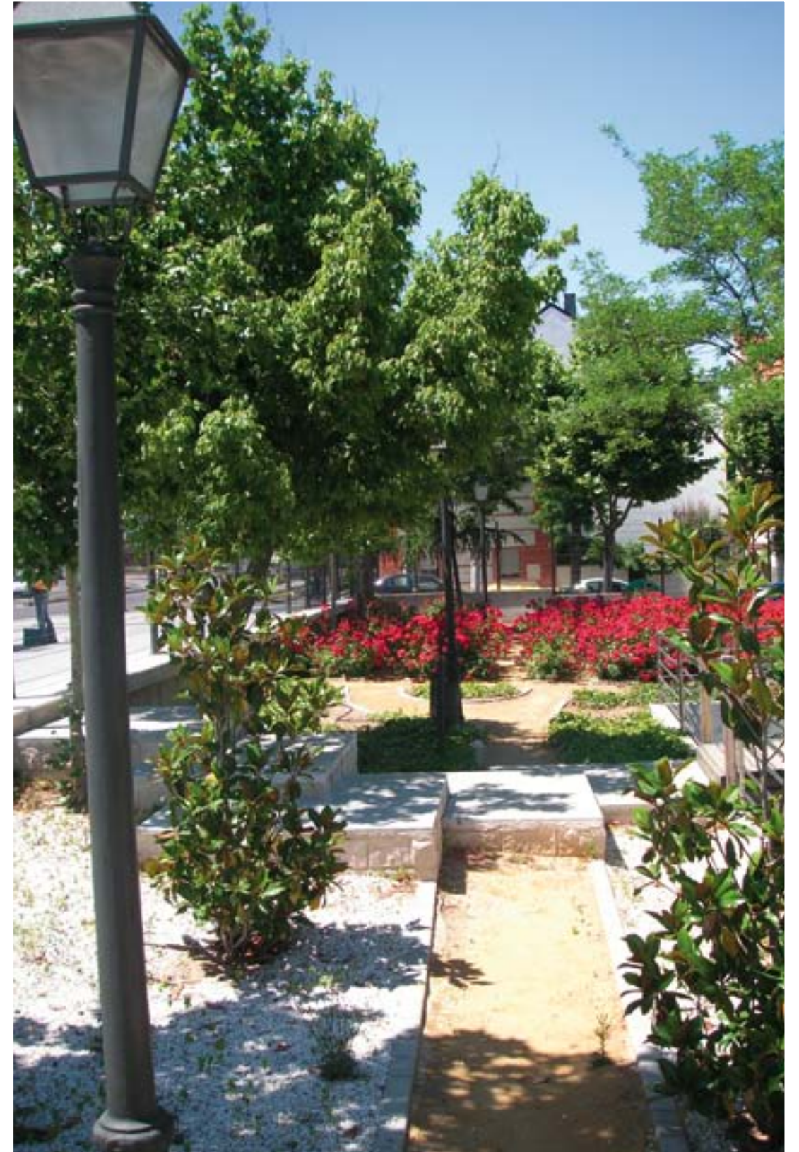
PARQUE DE LA ESTACIÓN (AVENIDA PRÍNCIPE DE ASTURIAS)