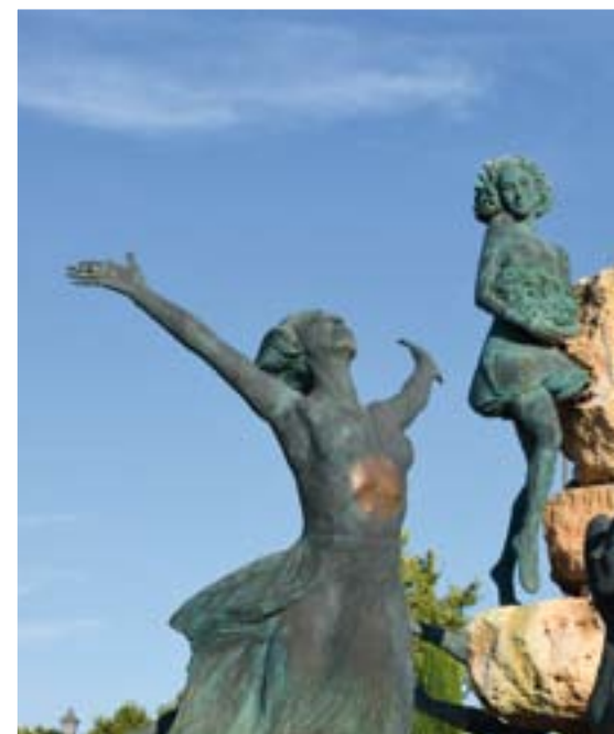
FUENTE DE LAS HADAS, OBRA DE PILAR CUENCA (AVENIDA PRÍNCIPE DE ASTURIAS)