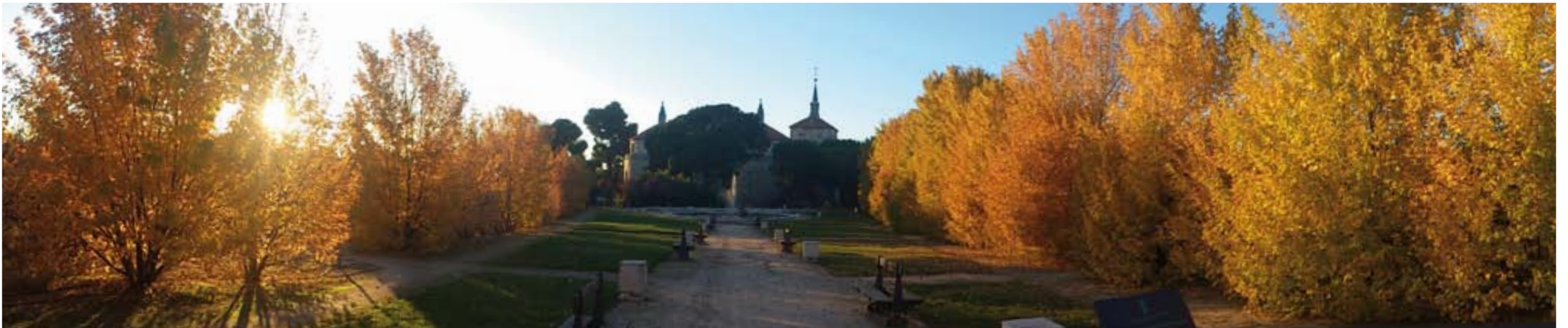
JARDÍN HISTÓRICO REALIZADO POR EL ARQUITECTO JULIO CANO LASSO EN BASE AL PROYECTO DISEÑADO POR JUAN BAUTISTA SACHETTI EN 1739 POR ORDEN DEL REY FELIPE V (AVENIDA DE MADRID)