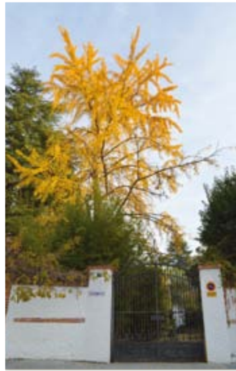
GINKGO BILOBA, ÁRBOL DE ORIGEN ASIÁTICO (GLORIETA DEL DOCTOR MERELLO)