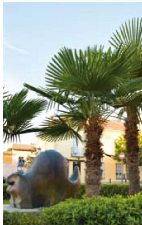
EL RINOCERONTE, OBRA DE FRANCISCO OTERO BESTEIRO (PLAZA DEL HUMILLADERO)