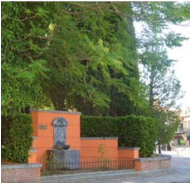
FUENTE ITALIANA, OBRA REALIZADA POR OBRADORES FLORENTINOS. SIGLO XVII (CALLE DEL ARROYO)