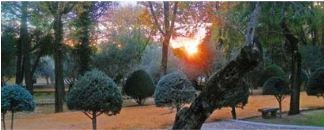
JARDINES DE DOÑA LAURA GARCÍA NOBLEJAS