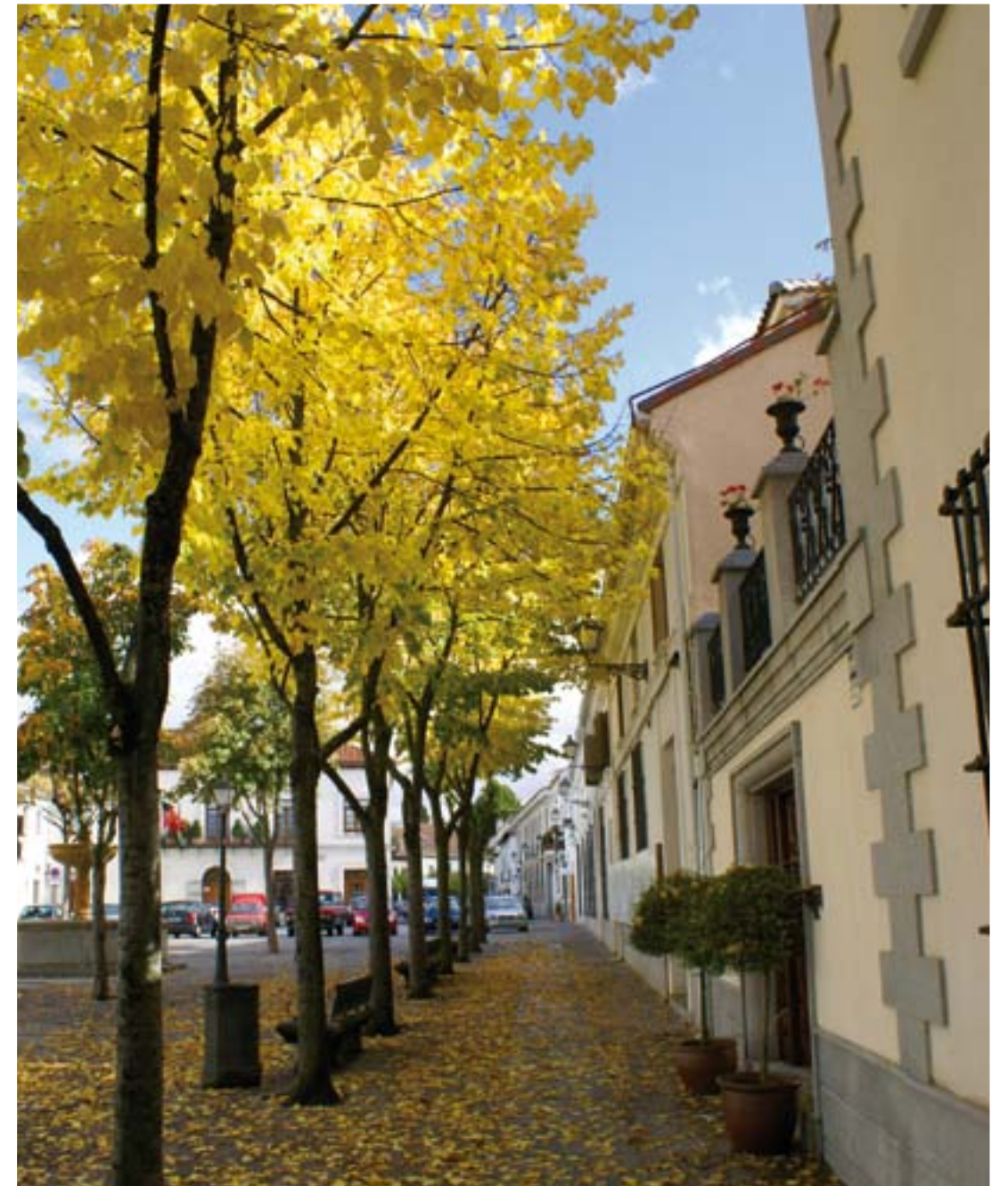
PLAZA DE LA CONSTITUCIÓN

Hoy te quiero cantar hoy te quiero rezar Madre mía del cielo si en mi alma hay dolor busco apoyo en tu amor y hallo en ti mi consuelo -Estrillo- Hoy te quiero cantar hoy te quiero rezar Virgen de la Soledad hoy te quiero ofrecer lo más bello y mejor que hay en mi corazón. Porque tienes a Dios (bis) Madre todo lo puedes soy tu hijo también (bis) y por eso me quieres -Estrillo- Dios te quiso elegir (bis) como puente y camino que une el hombre con Dios (bis) en abrazo divino. -Estrillo-