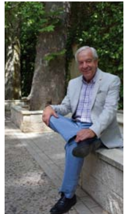
CALLE IGNACIO ROLDÁN