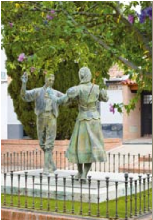
EL RONDÓN, OBRA DE ANA OLANO (PLAZA DEL MAESTRO JOSÉ PALANCAR)