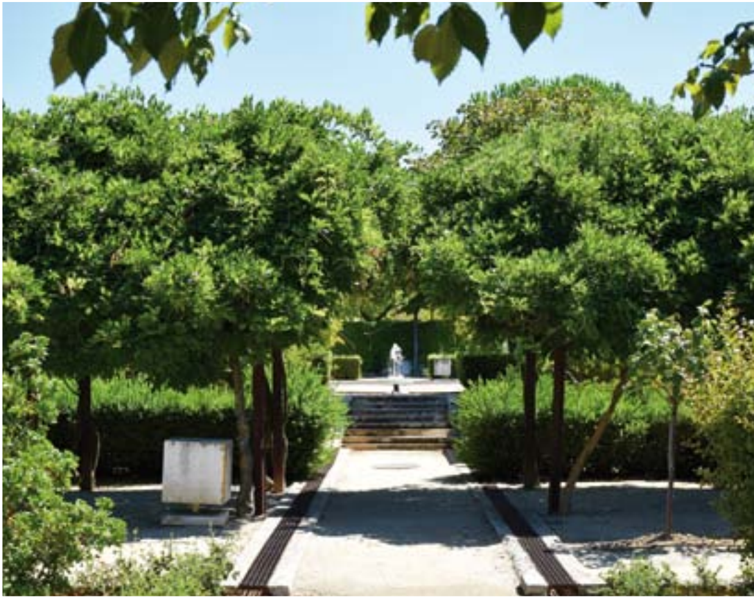
JARDÍN HISTÓRICO (AVENIDA DE MADRID)