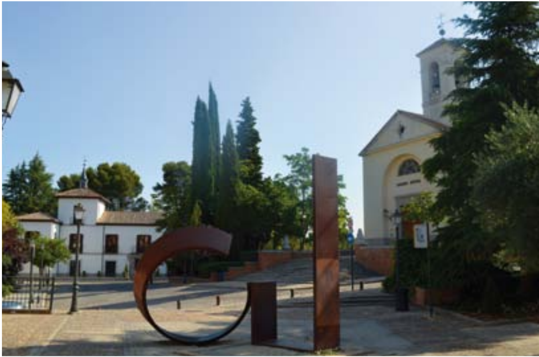
IGLESIA DE SANTIAGO APÓSTOL, CASA PALACIO MANUEL GODOY Y ESCULTURA AURA IV, OBRA DE LUIS DE ULLOA (CALLE DE LA IGLESIA Y CALLE ARROYO)